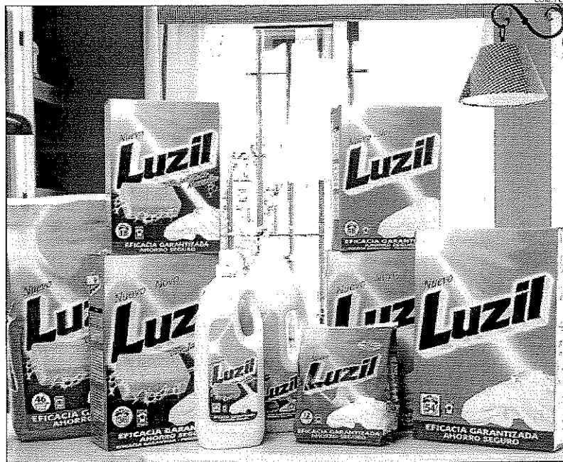
Bodegón de productos de la marca Luzil fabricada por la murciana Linasa

La firma murciana Fincadelia, especializada en la prestación de servicios de administración de fincas, continúa consolidando su presencia en diferentes zonas de España, con la apertura de dos nuevas franquicias en Tenerife y Valladolid. La oficina de Tenerife tendrá como zona de exclusividad toda la parte sur de la isla;