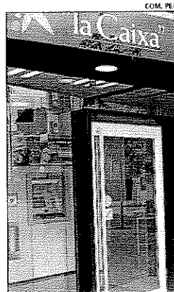
Oficina de La Caixa

Esta emisión, cuyo desembolso se hará efectivo el próximo 9 de